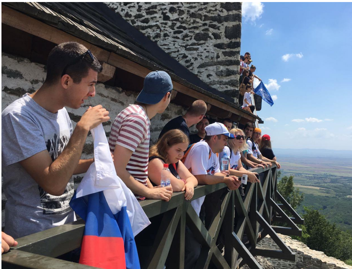
Бела Црква – Блажево Јул, 2018.