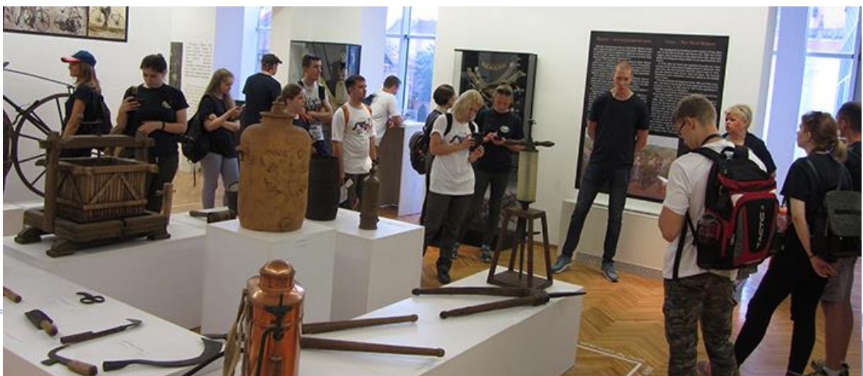
Бела Црква – Блажево Јул, 2018.