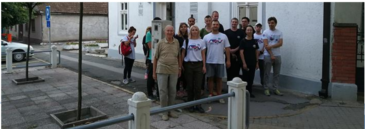
Бела Црква – Блажево Јул, 2018.