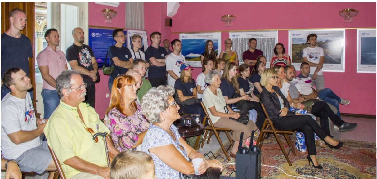
Бела Црква – Блажево Јул, 2018.