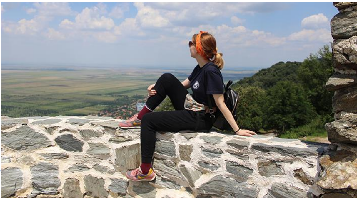
Бела Црква – Блажево Јул, 2018.